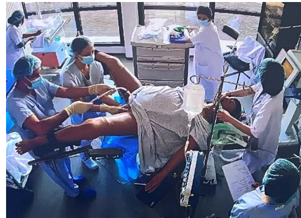
Séance de simulation haute fidélité internes d'anesthésie et d'obstétrique